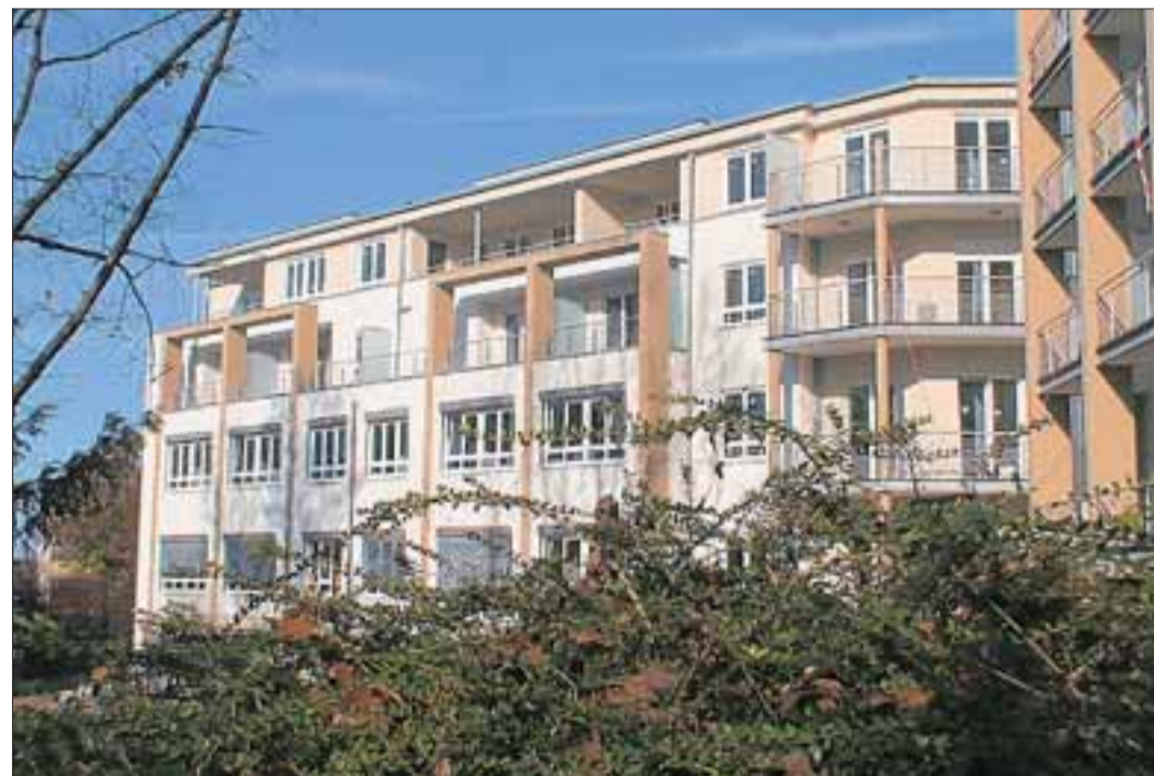
Die sonnenverwöhnte Rückseite der Residenz.