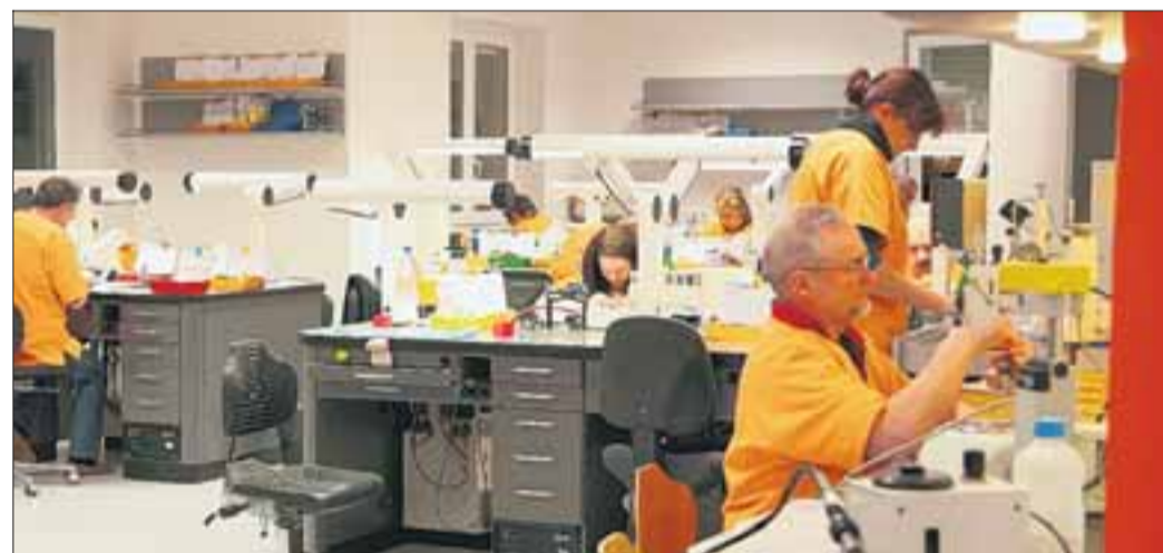
Blick in das Labor bei Reichel Zahntechnik.