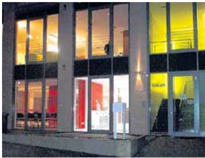
Ein Blickfang ist das Hermeskeiler Gebäude auch bei Nacht.

Ende Juli 2006 waren dort, wo heute die Residenz am Park die Silhouette von Hermeskeil ganz neu prägt, erst einige Bäume gefällt . Nichts deutete darauf hin, dass sich hier innerhalb von 16 Monaten eine Baulücke der Hochwaldstadt auf attraktive Art und Weise schließen würde.