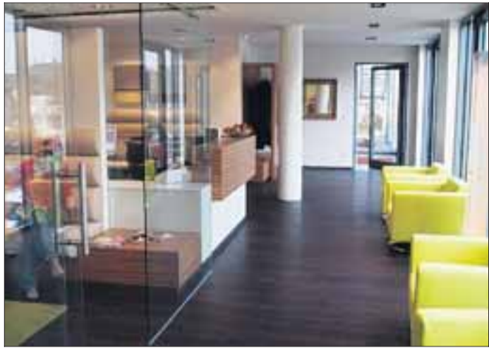
Die Anmeldung der Praxis für Zahnheilkunde & Implantologie Kropidlowski.

Im Rahmen eines Tages der Offenen Tür am 9. Dezember von 14-18 Uhr präsentieren sich das Dentallabor Reichel Zahntechnik, Pflegedienst pro Humanitas Weber und Praxis für Zahnheilkunde & Implantologie Kropidlowski.